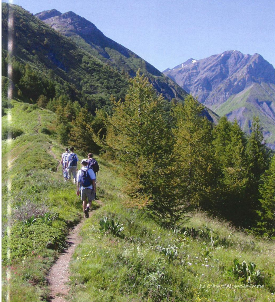
La crête d'Albiez-le-jeune

“L'OBJECTIF EST DE MONTER SUR LA LIGNE DE CRÊTES POUR AVOIR UNE VUE PANORAMIQUE À 360°, Y COMPRIS SUR LE MONT BLANC. ÇA GRIMPE UN PEU AU DÉPART. ON PART DANS UNE FORÊT DE MÉLÈZES AVEC DES FLEURS EN PAGAILLE POUR REJOINDRE LES ALPAGES.”